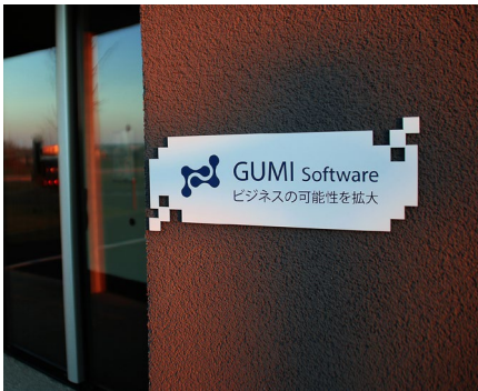
POP-Displays und Schildergravur