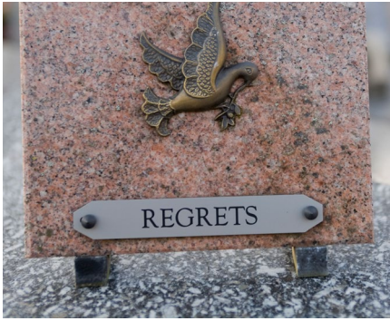
Gravur von Grabplatten und Grabsteinen