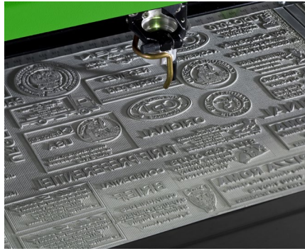
Gravieren & Schneiden von individuellen Farbstempeln