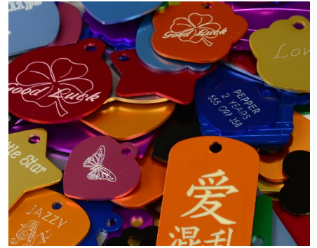
Haustier- und Hundemarkengravur