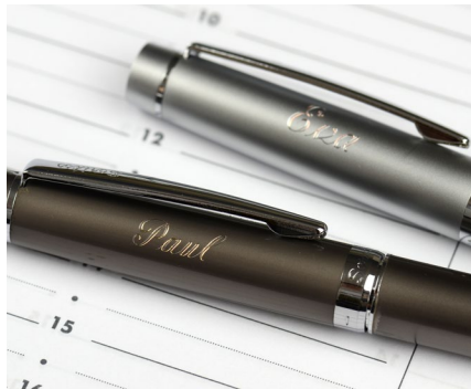
Gravur von Schreibgeräten