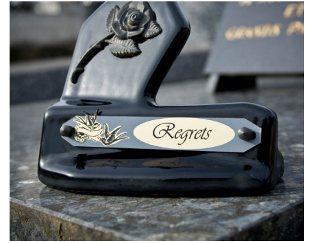
Gravur von Grabplatten und Grabsteinen