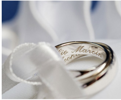
Personalisierung und Gravur von Schmuck