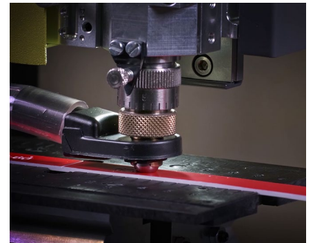
Erstellung von Typenschildern