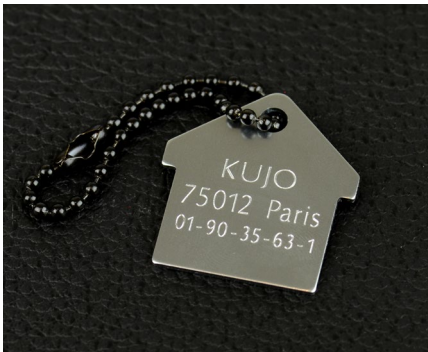
Gravur von Tieranhängern