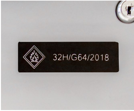
Identifikation und Rückverfolgbarkeit von Geräten