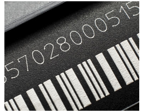
Erstellung von Etiketten