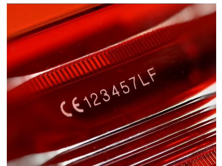
Beschriftung von Glas und durchsichtigen Kunststoffen