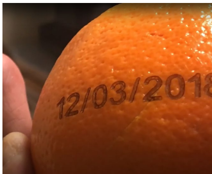
Markierung von Obst und Gemüse